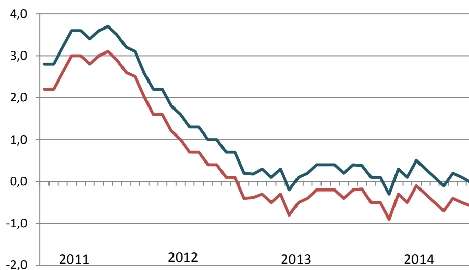
Diagram 1: Inflationstakten 2011-2014, 95 % konfidensintervall